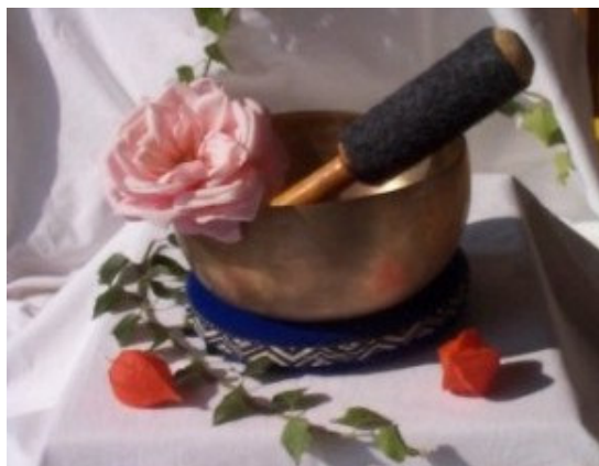
zur Klangschalen-Galerie ➡

Etwas abseits von der Geschichte hatten diese Wanderungen ihren Einfluß auf die an den Himalaya angrenzenden Länder. In den drei heutigen Bundesstaaten Assam, Bengalen und Orissa wurden und werden ebenfalls Klangschalen hergestellt. Jeder dieser Orte entwickelte dabei Klangschalen mit eigenem Charakter und Merkmalen. Weil diese Länder in den vergangenen Jahrzehnten nicht so stark im Brennpunkt der Antiquitätensammler waren, ist es hier noch möglich, alte Schalen zu finden und zu kaufen. Allerdings sind viele Schalen gerissen und lädiert, so daß es schwierig ist, wohlklingende Klangschalen zu finden.