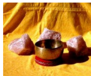
zur Klangschalen-Galerie ➡

ein weiterer Ton, der Wichtigkeit erlangt hat. Zugrunde liegt die 7Hz Frequenzmessung des Meditation-Zustands während des EEG, in dem sich Wachträume oder erkenntnisreiche Visionen ereignen können. Der Zustand fördert die Erinnerungs- und Lernfähigkeit. Allerdings ist auch hier einschränkend zu sagen, das nur eine Mehrheit von dieser Frequenz angesprochen wird und das tatsächliche Spektrum der Thetawelle zwischen 5 und 8 Hz liegt. Zugehöriges Chakra: Solarplexus.