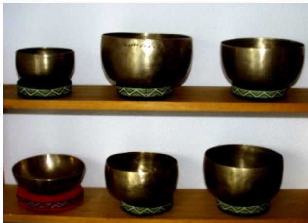
zur Klangschalen-Galerie ➡

exzentrischem und extremem Verhalten, zu Nervosität und Ungeduld. Wir wollen aus alten Ordnungen aus steigen, mit Konventionen brechen und suchen neue Formen des Miteinanders. Technische Erfindungen, die Computertechnologie, vernetztes Denken, Teamarbeit, blitzschnelle Erkenntnisse und die Astrologie gehören zur Symbolik des Uranus. Uranus regiert das Zeichen Wassermann und das elfte Haus. Das 11. Haus symbolisiert den Lebensbereich, in dem Sie sich frei von konventionellen Einschränkungen mit Ihren Interessen beschäftigen können und niemand anderem verpflichtet sind als Ihren humanitären Idealen und Ihrer Ethik von Freiheit, Unabhängigkeit, Toleranz und Gleichberechtigung. Es steht für Gruppenaktivitäten und Freundschaften, denen Sie sich durch Ihre geistige Haltung und gemeinschaftliche Anliegen verbunden fühlen, und beschreibt die Qualitäten, die Sie in diesem Bereich verwirklichen wollen. Seine Laufbahn um die Sonne dauert 84 Jahre.