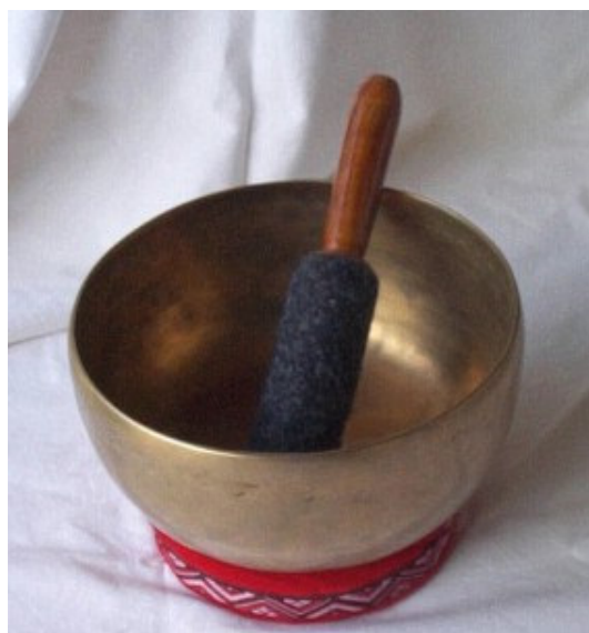
zur Klangschalen-Galerie ➡

Mit dieser Schwingung stärken Sie ihr Willenskräfte, energetisieren Sie sich und bündeln Ihre Konzentrationskräfte. Mars ist sozusagen ein kreatives Tonikum, das man am besten bei physischer Entkräftung oder ungewünschter Müdigkeit zu sich nimmt. Auf physischer Ebene eignet sich die Schwingung zur Stärkung von Nägeln und Zähnen. Sie unterstützt auch bei Problemen mit den Arteriene oder der Gallenblase.