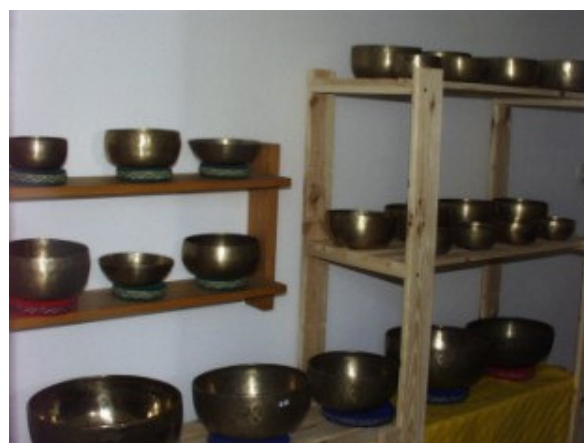
zur Klangschalen-Galerie ➡